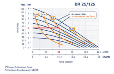
1" Pump - Performance Curve Performance based on water at 20°C